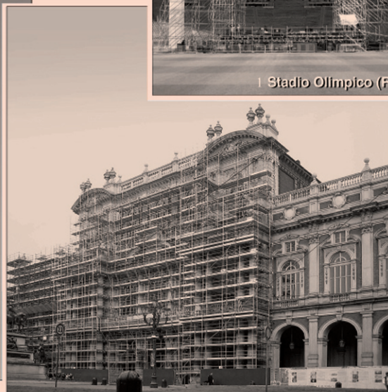
I Palazzo Carignano (TO)