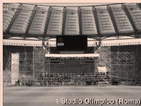
I Stadio Olimpico (Roma)