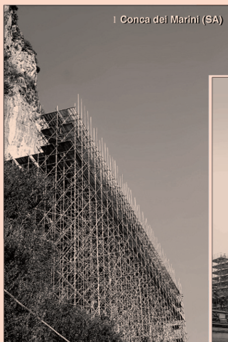
I Conca del Marini (SA)