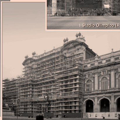
Palazzo Carignano (TO)